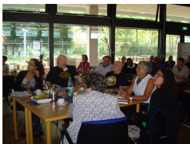
Journée d'évaluation

La matinée du mercredi est réservée à l'évaluation de la conférence de clôture mais aussi du projet dans son ensemble. Il est question de comment valoriser et mieux faire connaître ce réseau mais aussi et surtout de comment continuer à le faire vivre ; plusieurs pistes intéressantes ont été évoquées.