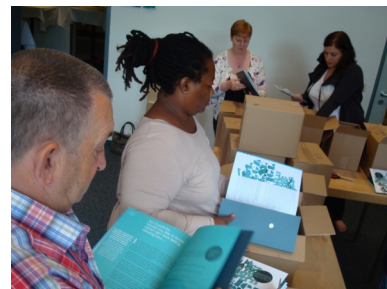
Travail d'équipe pour la manutention des publications

Les discours sont très variés : institutionnels et factuels pour certains, militants et autobiographiques pour d'autres.