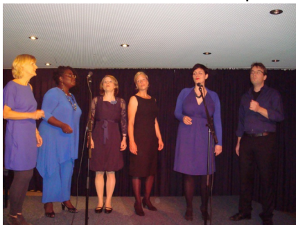
Concert de « Lady Talk »

C'est la répétition générale avant le jour J. On installe les stands, on répète la pièce de théâtre et on prend nos marques sur la scène. On en profite aussi pour finaliser la brochure : il faut encore y glisser le Manifesto et la charte et coller le DVD sur le rabat. Sans se tromper entre le français et l'anglais ! La