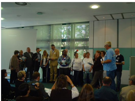
La lecture du Manifesto par des apprenants

En deuxième partie de matinée, formateurs et apprenants entrent en scène. Les formateurs nous expliquent comment ils ont élaborés leur charte, nous présentent un outil pour l'analyse réflexive et nous livrent leurs réflexions sur l'importance de la créativité. « Fun is a serious business! ».